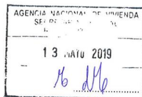
Arq. Eneida de León Ministra de Vivienda, Ordenamiento Territorial y Medio Ambiente

13º.- Pase a la Agencia Nacional de Vivienda cometiéndole la comunicación a la Dirección General Impositiva, al Banco de Previsión Social, y a la Dirección Nacional de Aduanas, así como la notificación a la empresa y publicación en la página web institucional, cumplido comuníquese a la Comisión Asesora de Inversiones en Vivienda de Interés Social.