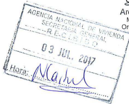
Arq. Eneida de León Ministra de Vivienda, Ordenamiento Territorial y Medio Ambiente

12º.- Pase a la Agencia Nacional de Vivienda cometiéndole la comunicación a la Dirección General Impositiva, al Banco de Previsión Social, y a la Dirección Nacional de Aduanas, así como la notificación a la empresa y publicación en la página web institucional, cumplido comuníquese a la Comisión Asesora de Inversiones en Vivienda de Interés Social.-